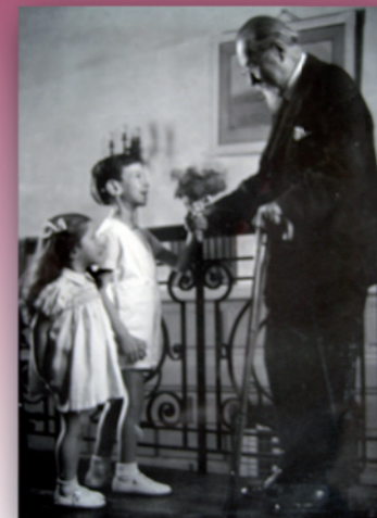
E. Jaques-Dalcroze à ses 80 ans

La dernière image / Les funérailles / Le boulevard Jaques-Dalcroze