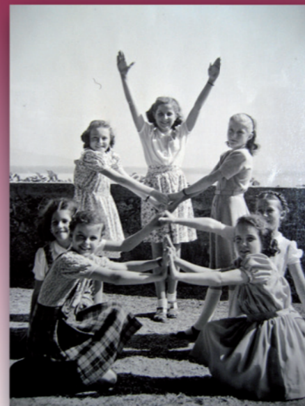
Elèves de rythmique à Nyon (1948)

Ce que M. Jaques m'a donné / Présentation / L'enfance / L'étude du piano / Trois ans à l'Institut J-Dalcroze / Début de la rythmique à Nyon